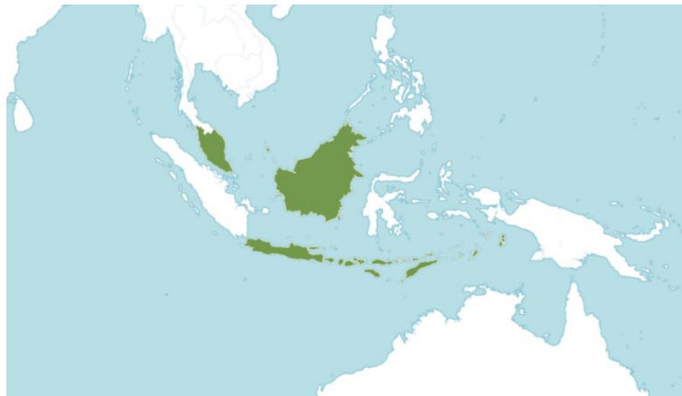
Gambar 2. Sebaran S. burahol di dunia yang direpresentasikan dengan warna hijau

Bogor, Kebun Raya Purwodadi, Taman Mini Indonesia Indah, dan Taman Kiai Langgeng Magelang. Hal ini menunjukkan bahwa daerah Jawa merupakan daerah pusat keragaman dan memungkinkan sebagai daerah asal tanaman ini (Gambar 2). Selain itu, menurut Umiyah (2005) daerah persebaran kepel juga meliputi Sumatera, Kalimantan, dan Bali.