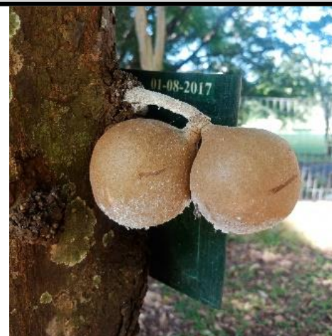
Buah kepel koleksi Kebun Raya Purwodadi

Kebun Raya Purwodadi, Pusat Riset Konservasi Tumbuhan dan Kebun Raya – BRIN email: melisbio08@gmail.com