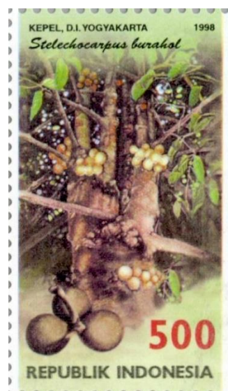
Gambar 3. Perangko bergambar tanaman kepel sebagai flora identitas Yogyakarta

Bagi masyarakat Yogyakarta, kepel dijuluki sebagai pohon keraton, tidak hanya karena menjadi buah kesukaan putri keraton dan diandalkan sebagai salah satu bahan perawatan tubuh, tetapi juga dianggap sebagai salah satu pohon keramat di kalangan Keraton Ngayogyakarta Hadiningrat. Konon pada zaman dahulu, raja menitahkan agar tanaman ini hanya boleh ditanam di halaman keraton dan rumah para pejabat tinggi setingkat adipati. Rakyat tidak berani menanamnya di pekarangan rumah karena takut terkena tuah dan tertimpa bala bencana. Akhirnya, pohon kepel hanya dapat dijumpai di lingkungan yang dimiliki oleh kerajaan dan menjadi langka, terutama di Pulau Jawa (Haryjanto, 2012). Selain sarat mitos, tanaman kepel juga memiliki nilai filosofi penting bagi keraton Yogyakarta yakni nilai " Adiluhung " yang berarti kesatuan dan keutuhan mental fisik; dan " manunggaling sedyo kaliyan gegayuhan " yang berarti bersatunya niat dengan kerja. Kedua nilai yang melekat pada kepel tersebut menjadikannya sebagai flora identitas Daerah Istimewa Yogyakarta (DIY) melalui Keputusan Gubernur Kepala DIY No. 385/KPTS/1992 tentang Penetapan Flora dan Fauna Daerah Propinsi DIY (Kehati Jogja, 2021). Sebagai salah satu bentuk konservasi melalui pengenalan kepada masyarakat umum, PT. POSINDO menerbitkan perangko buah kepel pada tahun 1998 yang menggambarkan flora identitas Yogyakarta (Gambar 3).